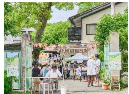
オープンパークのイメージ

時間：午前11時～午後3時 会場：旧公園管理事務所・広場 キッチンカーなどの飲食のほか、文具・アート・植物・本などのお店が園内に出現します。