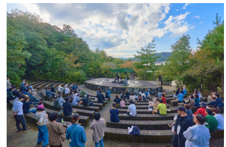
パークライブのイメージ

※ 船岡山オープンパーク・パークナイトの詳細情報は、「FUNAGORA Instagram」で御確認ください。